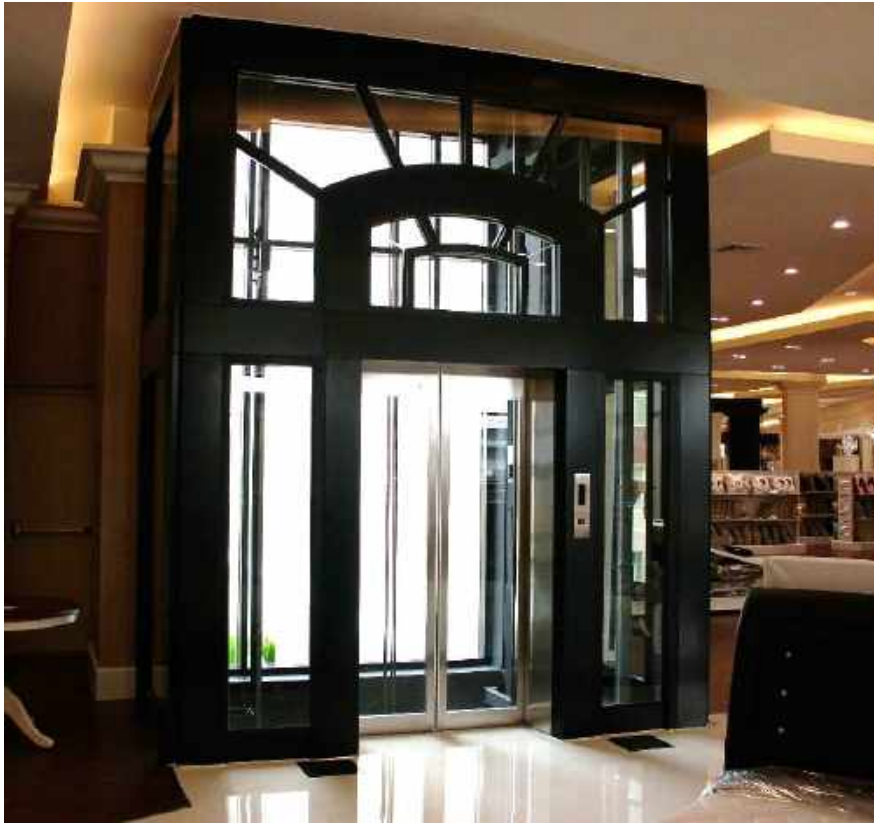
ลิฟต์แก้ว