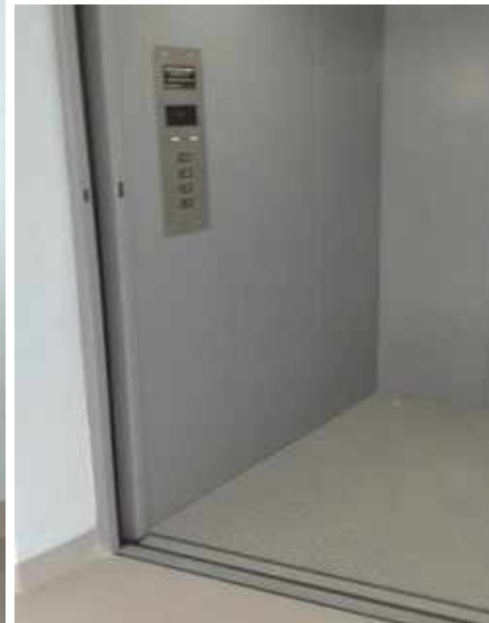
FRIGHT LIFT ประตูลิฟต์