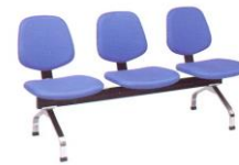
LC 423 46(W) x 61(D) x 82(H) x 45(SL) x 160(TW) cm.