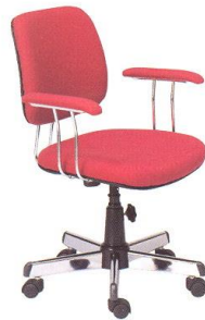
AS 12-A 58(W) x 51-55(D) x 85-90(H) x 45(SL) cm.