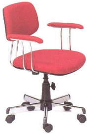
AS 11-A 58(W) x 51-55(D) x 80-85(H) x 45(SL) cm.