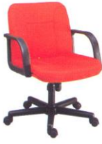
AS 112-A 60(W) x 62(D) x 79(H) x 45(SL) cm.