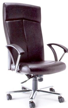
SC-06 64 x 70 x 115 см.