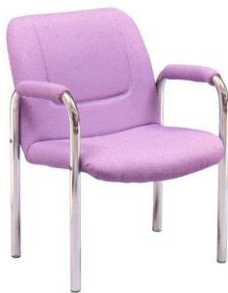
SF 81 58(W) x 63(D) x 73(H) x 41(SL) cm.