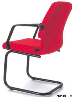
NS-3A ממדים 56 x 62 x 86 סמ.