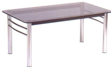
SF 82 61(W) x 106(D) x 48(Height) cm.