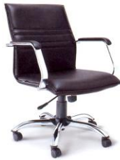
EX 6 61 x 68 x 90 มม.