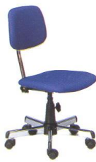
AS 17 45(W) x 53(D) x 81(H) x 43(SL) cm.