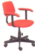
AS 16-A 55(W) x 51(D) x 81(H) x 45(SL) cm.