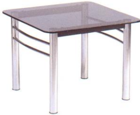
SF S82 61(W) x 61(D) x 48(Height) cm.