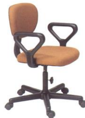
AS 15-A 60(W) x 53(D) x 83(H) x 46(SL) cm.