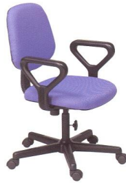
AS 14-A 60(W) x 55(D) x 86(H) x 45(SL) cm.