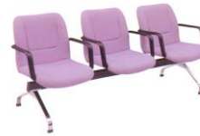
LC 413-A 60(W) x 65(D) x 80(H) x 44(SL) x 191(TW) cm.