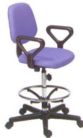
AS 23-A 60(W) x 54(D) x 101(H) cm.