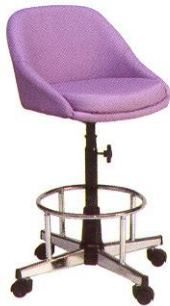
CR 609 46(W) x 67(SL) x 29(FL) cm.