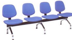
LC 424 46(W) x 61(D) x 82(H) x 45(SL) x 218(TW) cm.