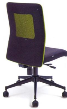
● ME02 B