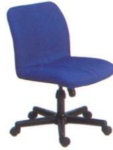
AS 113 49(W) x 62(D) x 79(H) x 43(SL) cm.