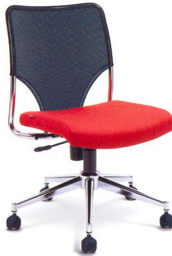
● ME06 B