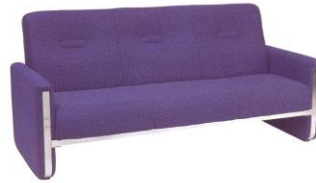
SF 913 181(TW) x 80(D) x 84(H) x 40(SL) cm.