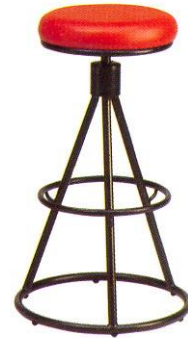
CR 611 34(W) x 75(SL) x 31(FL) cm.