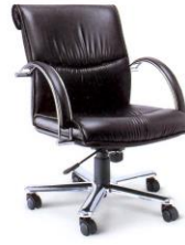
EX-3 ขนาด 63 x 73 x 89 มม.