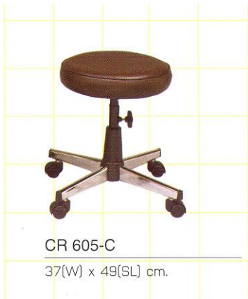
CR 605-C 37(W) x 49(SL) cm.