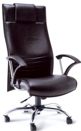
SC-01 64 x 70 x 124 mm.