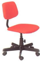
AS 16 45(W) x 51(D) x 81(H) x 45(SL) cm.