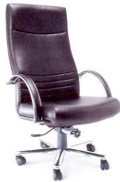
EX-7 65 x 79 x 114 cm.