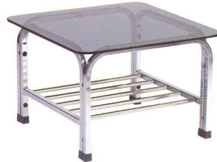
SF S92 61 x 61 x 42(Height) cm.