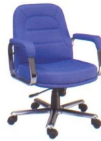
AS 012 61(W) x 61(D) x 91(H) x 45(SL) cm. (screw-thread) 61(W) x 61(D) x 90(H) x 44(SL) cm. (gas shock absorber)