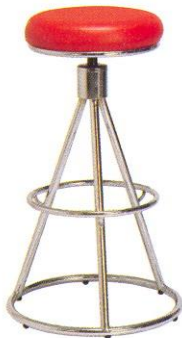
CR 611-C 34(W) x 75(SL) x 31(FL) cm.