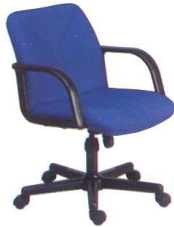
AS 113-A 60(W) x 62(D) x 79(H) x 43(SL) cm.