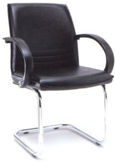
NS-6A 58 x 61 x 85 ၂မ.