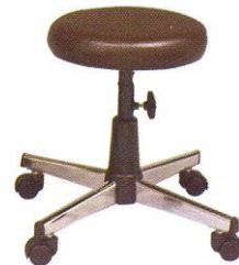
CR S605-C 34(W) x 47(SL) cm.