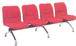
LC 414 49(W) x 65(D) x 80(H) x 44(SL) x 220(TW) cm.