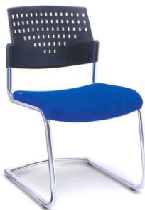
PL 2 ၂မ ၇၈ ၄၈ x ၅၅ x ၈၂ ၂မ.