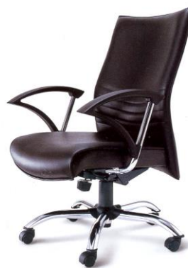
SC-02 64 x 68 x 124 mm.