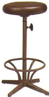
CR 602 34(W) x 71(SL) x 21(FL) cm.