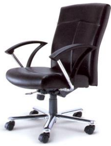
SC-07 64 x 68 x 94 cm.