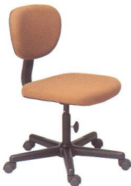
AS 15 45(W) x 53(D) x 83(H) x 46(SL) cm.