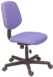
AS 14 45(W) x 55(D) x 86(H) x 45(SL) cm.