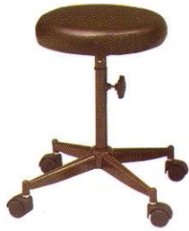
CR 600-W 34(W) x 51(SL) cm.