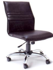
EX-6 (ไม่มีที่เท้าแขน)