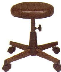
CR S605 34(W) x 47(SL) cm.