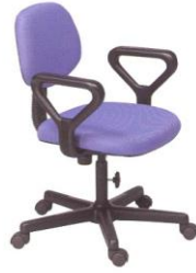
AS 13-A 60(W) x 54(D) x 83(H) x 45(SL) cm.