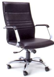
EX-5 63 x 71 x 106 มม.