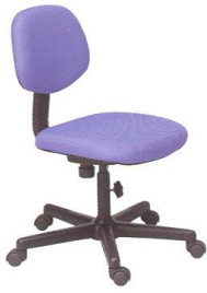
AS 13 45(W) x 54(D) x 83(H) x 45(SL) cm.