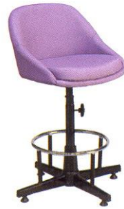
CR 608 46(W) x 63(SL) x 25(FL) cm.