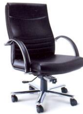
EX-8 650 x 780 x 1000 มม.