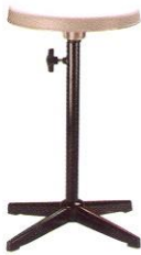
PS 04 33(W) x 58(SL) cm.