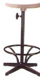
PS 05 33(W) x 65(SL) x 21(FL) cm.