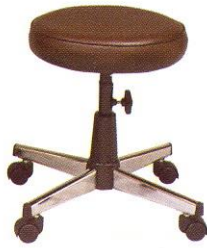
CR 605-C 37(W) x 49(SL) cm.