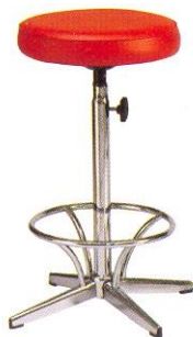
CR 604 37(W) x 71(SL) x 22(FL) cm.