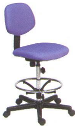
AS 23 45(W) x 54(D) x 101(H) x 63(SL) x 26-46(FL) cm.