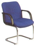
AS 313-A 60(W) x 62(D) x 81(H) x 45(SL) cm.