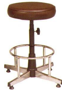
CR 603-C 37(W) x 61(SL) x 25(FL) cm.