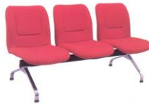
LC 413 49(W) x 65(D) x 80(H) x 44(SL) x 165(TW) cm.