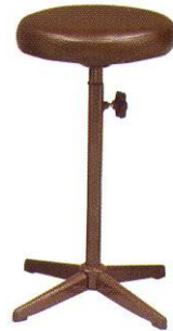
CR 601 34(W) x 64(SL) cm.