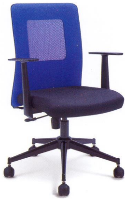
● ME01 B