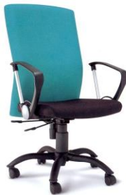
TT-1A 60 x 63 x 101 cm.