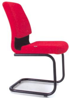
NS-3 ממדים 47 x 62 x 86 סמ.