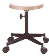
PS 02 33(W) x 45(SL) cm.