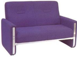
SF 912 128(TW) x 80(D) x 84(H) x 40(SL) cm.