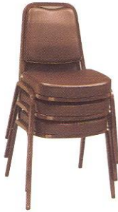
CE 241 45(W) x 59(D) x 79(H) x 45(SL) cm.