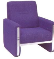
SF 911 75(TW) x 80(D) x 84(H) x 40(SL) cm.