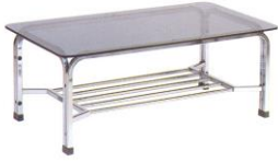
SF 92 61(TW) x 106(D) x 42(Height) cm.