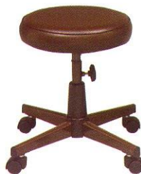
CR-605 37 x 49 cm.