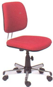
AS 12 45(W) x 51-55(D) x 85-90(H) x 45(SL) cm.