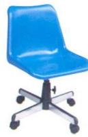
AS-18 46(W) x 51(D) x 77(H) x 44(SL) cm.