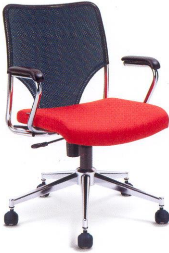
● ME05 B