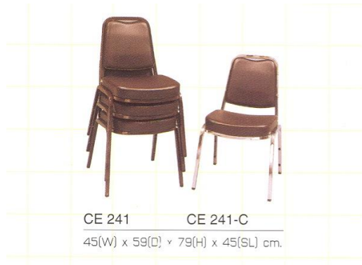
CE 241 CE 241-C 45(W) x 59(D) x 79(H) x 45(SL) cm.