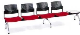
LC 64 (พิเศษ)