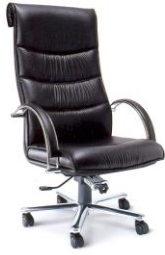
EX-1 65 x 78 x 118 cm.