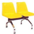
LC 432-P 990 x 520 x 770 mm.

บริษัท ไทยสตีลเฟอร์นิเจอร์ จำกัด 119/3-4 หมู่ 18 อ.สุพรรณบุรี จ.สุพรรณบุรี & สาขาโรงงาน 10130 โทร 463-0089, 463-6943, 463-2400 แฟกซ์ 02-463217 THAI STEEL FURNITURE CO.,LTD. 119/3-4 MOO18 Sukawot Rd, Prangdang Samutprakarn 10130 Tel. 463-0089, 463-6943, 464-3767-9 Fax. 463-2176