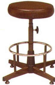
CR 603 37(W) x 61(SL) x 25(FL) cm.