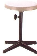
PS 03 33(W) x 45(SL) cm.