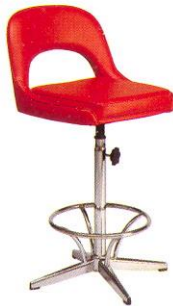
CR 610 45(W) x 67(SL) x 22(FL) cm.