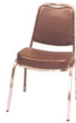
CE 241-C 45(W) x 59(D) x 79(H) x 45(SL) cm.