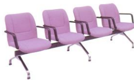
LC 414-A 60(W) x 65(D) x 80(H) x 44(SL) x 260(TW) cm.