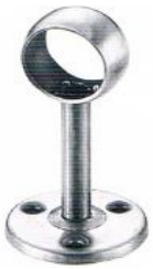
หัวรับแป๊ปสแตนเลสท่อเหล็ก ขนาด 1" ขนาด 6 หุน