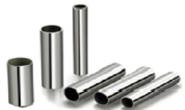
แป๊ปกลมสแตนเลส ขนาด 1x0.8 mmx6M ขนาด 1".x1 mmx6M ขนาด 6หุน.x 1 mmx6M ขนาด 6หุน.x 1 mmx6M ขนาด 5หุน.x 1 mmx6M ขนาด 3หุน.x 1 mmx6M