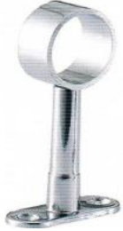
หัวรับแป๊ปกลมท่อเหล็ก 1" ปรับได้