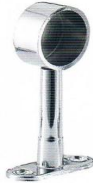
หัวรับแป๊ปกลมท่อตัน 1" ปรับได้