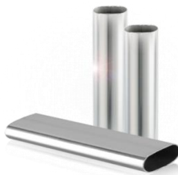
แป๊ปรูปร่างท่อสแตนเลส ขนาด 0.8mmx 6 M