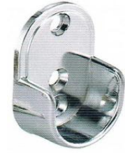
แป้นรับแป๊ปกลม 1"