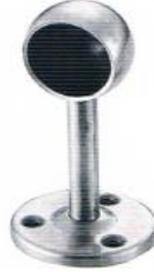
หัวรับแป๊ปสแตนเลสท่อตัน ขนาด 1" ขนาด 6 หุน