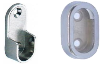
แป้นรับแป๊ปรูปร่าง ตัว U/ มีฝาครอบเล็ก