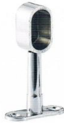
หัวรับแป๊ปรูปร่างท่อตัน ปรับได้ 19 มิล