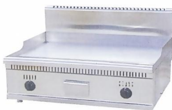
Gas Griddle (Flat Plate) Model : ET-TGG-792 W730xD595xH465mm Power:54,560BTU/hr N/W:45kg