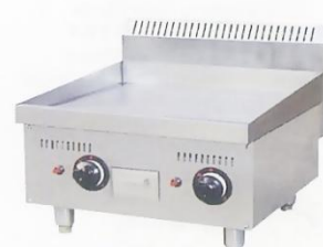
Gas Griddle (Flat Plate) Model : ET-TGG-24 W610xD660xH565mm Power:48,000BTU/hr N/W:74kg