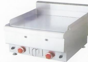
Gas Griddle (Flat Plate) Model : ET-JUS-TRG60 W600xD650xH475mm Power:34,120BTU/hr N/W:58kg