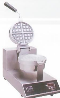
1-Plate Waffle Maker Model : ET-UWB-03 W255xD440xH320mm Volt:220V/50Hz Power:1KW N/W:11kg