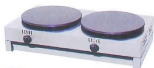
Gas 2-Plate Crepe Maker Model : ET-TGC-2 W860xD545xH280mm Power:34,122BTU/hr N/W:45kg