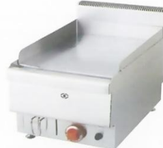
Gas Griddle (Flat Plate) Model : ET-JUS-TRG40 W400xD650xH475mm Power:17,060BTU/hr N/W:42kg