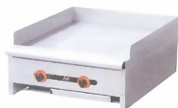
Gas Griddle (Flat Plate) Model : ET-RGT-24 W610xD840xH360+60mm Power:60,054BTU/hr N/W:91kg