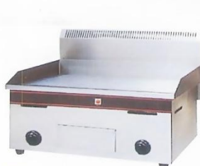
Gas Griddle (Flat Plate) Model : ET-TGG-720 W730xD585xH545mm Power:54,560BTU/hr N/W:40kg