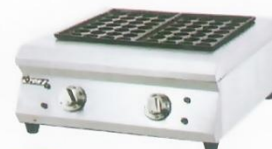
Gas Fish Pellet Grill Model : ET-RYW-2 W495xD525xH255mm Power:17,743BTU/hr N/W:23kg