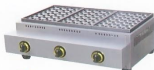
Gas Fish Pellet Grill Model : ET-TG-3BP W670xD490xH200mm Power:36,168BTU/hr N/W:31kg