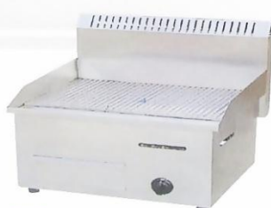
Gas Griddle (Grooved) Model : ET-TGG-721 W550xD550xH540mm Power:27,280BTU/hr N/W:29kg