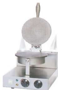
1-Plate Cone Maker Model : ET-TCB-1 W250xD380xH275mm Volt:220V/50Hz Power:1KW N/W:11kg