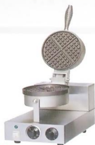
1-Plate Waffle Maker Model : ET-TWB-1 W250xD380xH275mm Volt:220V/50Hz Power:1KW N/W:11kg