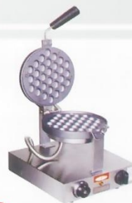
QQ Egg Cake Baker Model : ET-UWB-04 W280xD320xH277mm Volt:220V/50Hz Power:1.2KW Temperature:50-190°C N/W:7kg