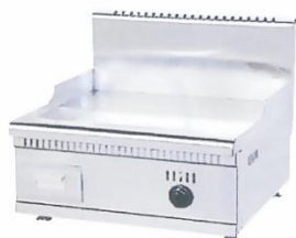
Gas Griddle (Flat Plate) Model : ET-TGG-791 W520xD515xH465mm Power:27,280BTU/hr N/W:32kg