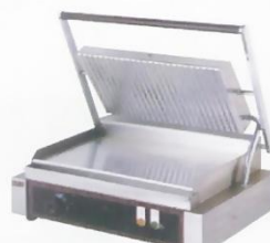
Electric Contact Griddle Double Model : ET-TCG-815 W460xD370xH190mm Volt:220V/50Hz Power:2.5KW N/W:20kg