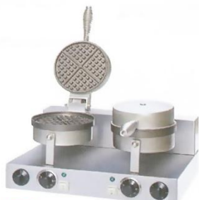
2-Plate Waffle Maker Model : ET-TWB-2 W500xD380xH275mm Volt:220V/50Hz Power:2KW N/W:21kg