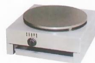
Gas 1-Plate Crepe Maker Model : ET-TGC-1 W450xD510xH235mm Power:17,061BTU/hr N/W:25kg