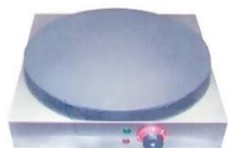
Electric 1-Plate Crepe Maker Model : ET-TEC-1A W410xD460xH225mm Volt:220V/50Hz Power:3KW N/W:18kg