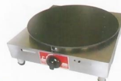
Gas 1-Plate Crepe Maker Model : ET-TGC-1A W410xD460xH225mm Volt:220V/50Hz Power:17,061BTU/hr N/W:18kg