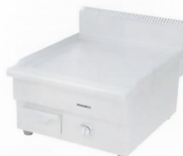
Gas Griddle (Flat Plate) Model : ET-TGG-488 W410xD620xH470mm Power:27,280BTU/hr N/W:32kg