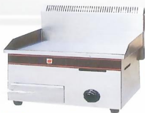
Gas Griddle (Flat Plate) Model : ET-TGG-718 W550xD550xH540mm Power:27,280BTU/hr N/W:30kg