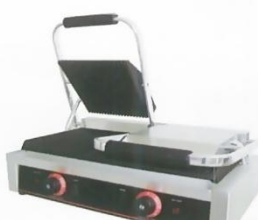
Electric Contact Griddle Double Model : ET-TCG-813 W565xD370xH190mm Volt:220V/50Hz Power:3.6KW N/W:28kg