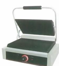
Electric Contact Griddle Single Model : ET-TCG-811E W460xD370xH190mm Volt:220V/50Hz Power:2.2KW N/W:20kg