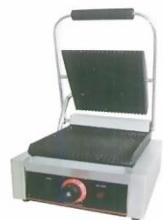
Electric Contact Griddle Single Model : ET-TCG-811 W305xD370xH190mm Volt:220V/50Hz Power:1.8KW N/W:14kg