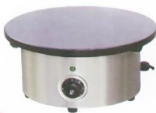
Electric Fish Pellet Grill Model : ET-DE-1-A Ø400xH200mm Volt:220V/50Hz Power:3KW N/W:20kg