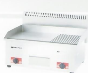
Gas Griddle (1/3 Grooved) Model : ET-TGG-722 W730xD585xH545mm Power:54,560BTU/hr N/W:38kg