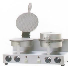
2-Plate Cone Maker Model : ET-TCB-2 W500xD380xH275mm Volt:220V/50Hz Power:2KW N/W:21kg