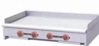
Gas Griddle (Flat Plate) Model : ET-RGT-36 W915xD840xH360+60mm Power:90,080BTU/hr N/W:129kg