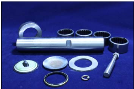
สลักเพลาน้ำ TX No. 1-87830221-0