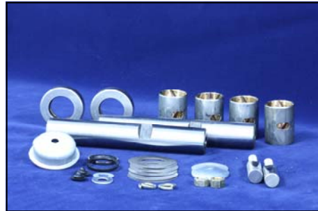
สลักเพลาน้ำ FE 449 No. MB420595