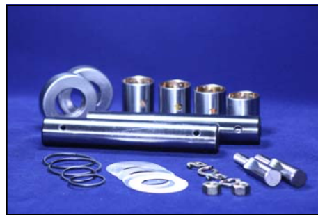
สลักเพลาน้ำ BU 3000 No. 04431-36020