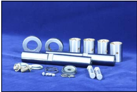
สลักเพลาน้ำ NPR-NKR 120 แร้ง No. 5-87830536-1 No. 5-87831608-1