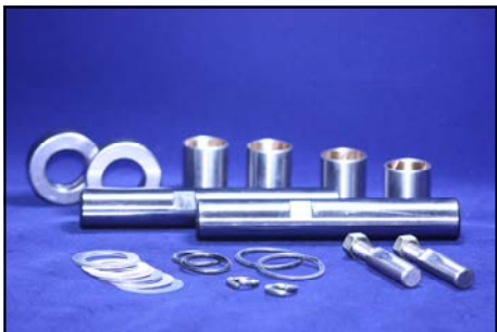
สลักเพลาน้ำ BUDDY 201 No. 9-88511507-0