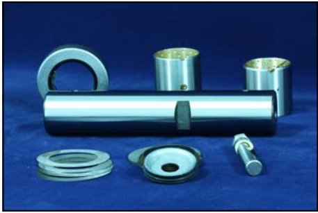
สลักเพลลาหน้า CW 41—CW 41 สลัก 10 นิ้ว No. 40025-90929 No. 40025-90064