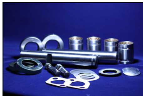
สลักเพลาน้ำ KT No. 04043-2009