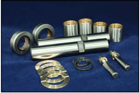
สลักเพลาน้ำ KM 505 No. 04043-2015