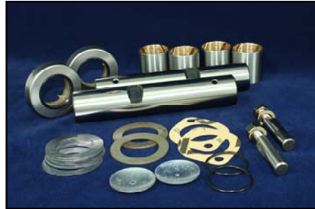
สลักเพลาน้ำ ROCKY 175/195 No. 1-87830363-0