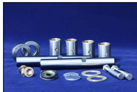
สลักเพลาน้ำ S250 สลักสั้น No. 5-87825168-0