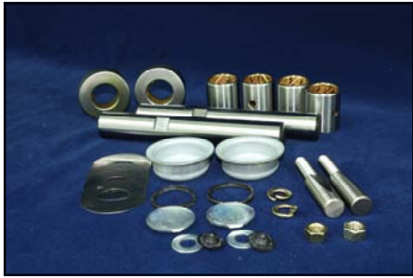
สลักเพลาน้ำ Canter 25 มิล No. MC294304