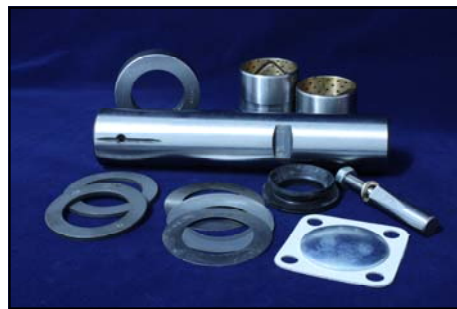
สลักเพลาน้ำ FN527 Turbo No. MC999971