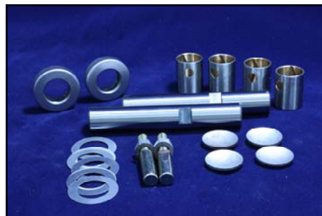
สลักเพลลาหน้า DUTSUN 521 No. 40022-14825