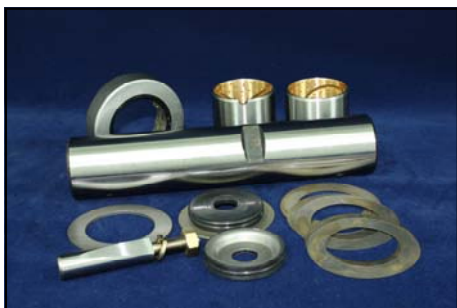
สลักเพลลาหน้า CW 30 No. 40025-90629