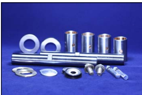
สลักเพลาน้ำ S250 No. 9-88511506-0