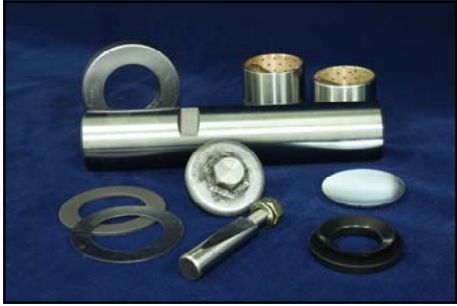
สลักเพลาน้ำ FN527 No. MC999970