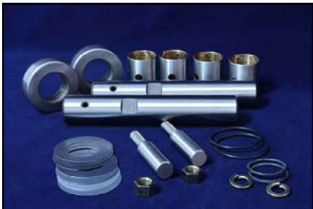
สลักเพลาน้ำ HINO DUTRO No. 04431-36070