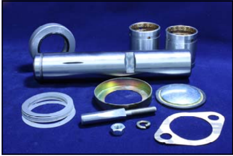
สลักเพลาน้ำ ZM No. 04043-2501