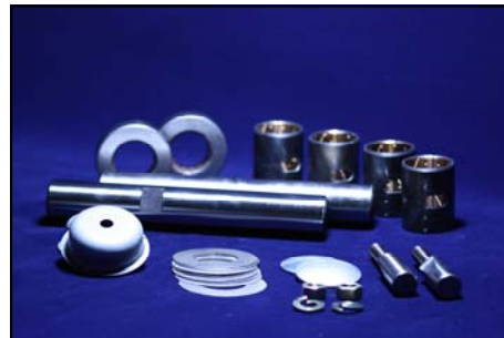
สลักเพลาน้ำ แคนเตอร์ T210-T211 No. MC294272 No. MC294273