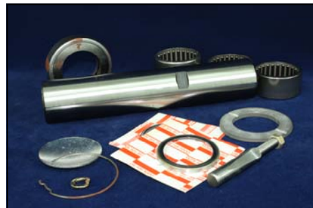
สลักเพลาน้ำ JUMBO No. 1-87830039-4