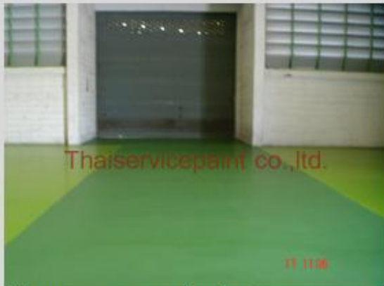
ชื่องาน :งานเคลือบพื้นพียู พื้นที่ใช้งาน :พื้นถนนหน้า Warehouse Location :นิคมฯ มาบตาพุด