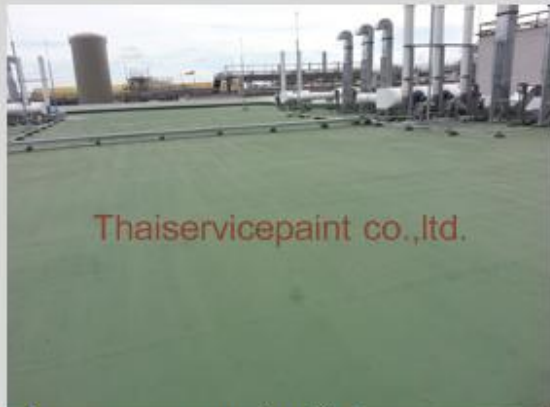
ชื่องาน :งานเคลือบพื้นพียู พื้นที่ใช้งาน :พื้นที่วางท่อส่งสารเคมี Location :นิคมฯ มาบตาพุด