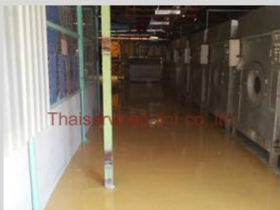
ชื่องาน :งานเคลือบพื้นพียู พื้นที่ใช้งาน :Warehouse โรงงานถลุงมือ Location :อ.ปลวกแดง จ.ระยอง