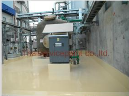
ชื่องาน :งานซ่อมเคลือบพื้นพียู พื้นที่ใช้งาน :พื้นที่ Warehouse Location :นิคมฯ มาบตาพุด