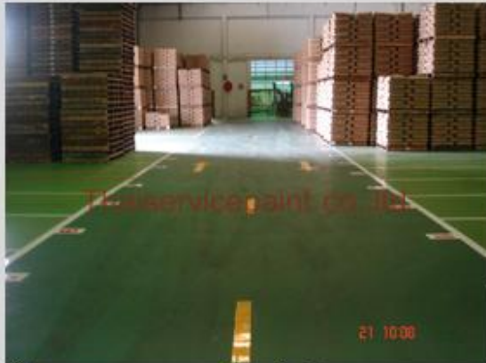
ชื่องาน :งานเคลือบพื้นพียู พื้นที่ใช้งาน :พื้น Warehouse Location :นิคมฯ ผาแดง-ระยอง