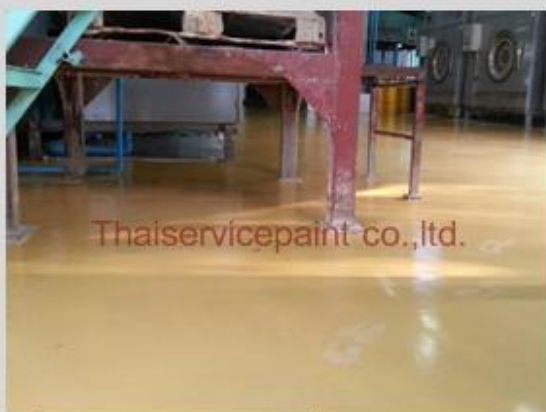
ชื่องาน :งานเคลือบพื้นพียู พื้นที่ใช้งาน :Warehouse โรงงานถลุงมือ Location :อ.ปลวกแดง จ.ระยอง