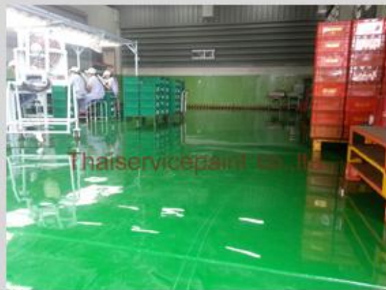
ชื่องาน :Epoxy Self Leveling พื้นที่ใช้งาน :พื้นที่ในโรงงาน วางเครื่องจักร Location :นิคมฯสยามอีสเทิร์น