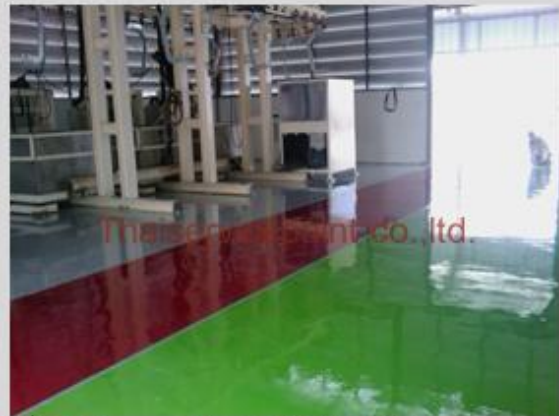
ชื่องาน :Epoxy Self Leveling พื้นที่ใช้งาน :พื้นที่ในโรงงาน วางเครื่องจักร Location :นิคมสยามอีสเทิร์น