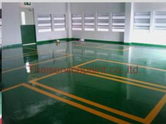
ชื่องาน :Epoxy Self Leveling พื้นที่ใช้งาน :พื้นที่ในโรงงาน วางสินค้า Location :ระยอง