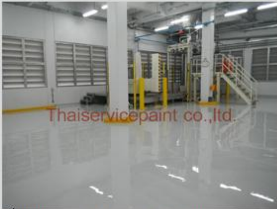
ชื่องาน :Epoxy Self Leveling พื้นที่ใช้งาน :พื้นที่ในโรงงาน วางเครื่องจักร Location :นิคมฯเอเชีย