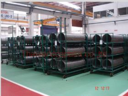
ชื่องาน :Epoxy Coating พื้นที่ใช้งาน :พื้นที่ในโรงงาน วางสินค้า Location :นิคมฯสยามอีสเทิร์น