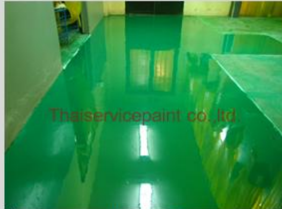
ชื่องาน :Epoxy Self Leveling พื้นที่ใช้งาน :งานซ่อมพื้น Epoxy Location :นิคมฯ อีสเทิร์นซีบอร์ด