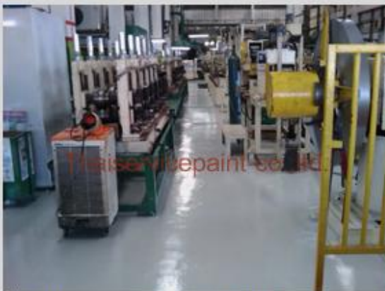
ชื่องาน :Epoxy Self Leveling พื้นที่ใช้งาน :พื้นที่ในโรงงาน ฝ่ายผลิต Location : นิคมฯมาบตาพุด