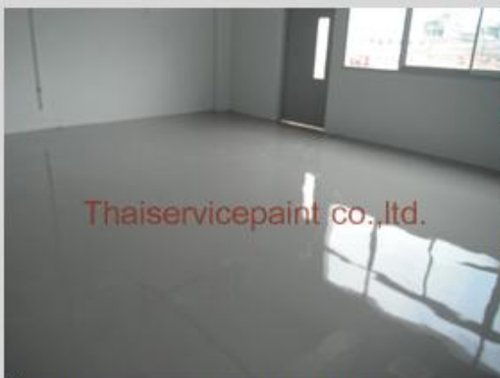
ชื่องาน :Epoxy Self Leveling พื้นที่ใช้งาน :สำนักงาน Location : นิคมฯมาบตาพุด