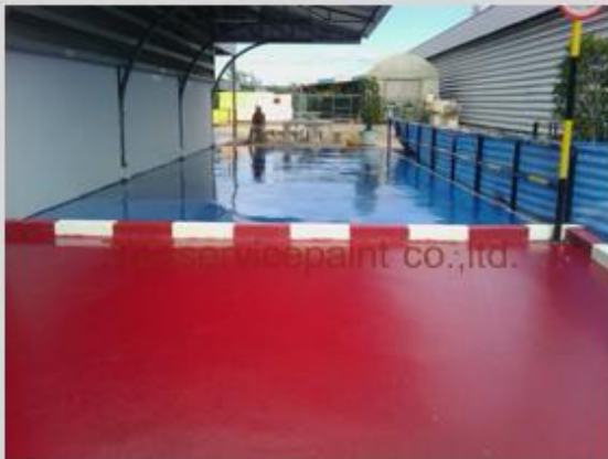
ชื่องาน :Epoxy Self Leveling พื้นที่ใช้งาน :พื้นที่ในโรงงาน Location :นิคมสยามอีสเทิร์น