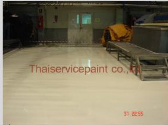
ชื่องาน :Epoxy Self Leveling พื้นที่ใช้งาน :พื้นที่ในโรงงาน วางเครื่องจักร Location :นิคมฯแหลมฉบัง