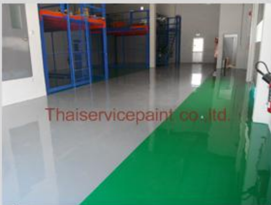
ชื่องาน :Epoxy Self Leveling พื้นที่ใช้งาน :พื้นวางเครื่องจักร Location :นิคมฯเหมราช