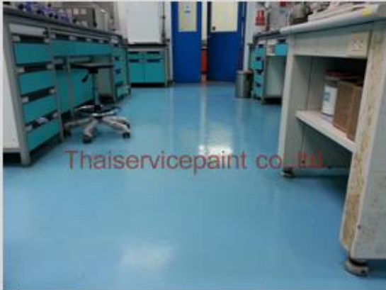
ชื่องาน :Epoxy Self Leveling พื้นที่ใช้งาน :พื้นที่ในโรงงาน ห้องแล็บ Location :ชลบุรี