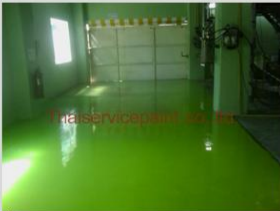
ชื่องาน :Epoxy Self Leveling พื้นที่ใช้งาน :พื้นที่ในโรงงาน Location :นิคมฯเหมราช ระยอง