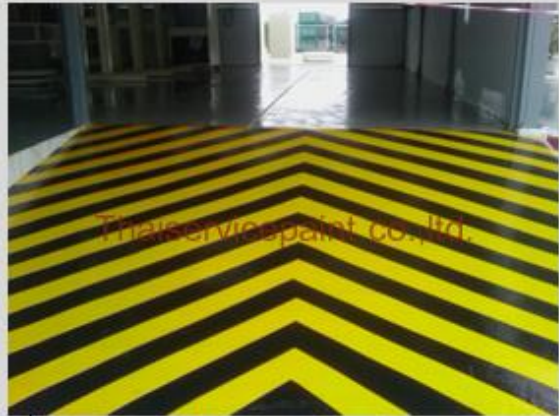
ชื่องาน :Epoxy Self Leveling พื้นที่ใช้งาน :พื้นที่ในโรงงาน ทางขึ้น-ลง Location :ระยอง