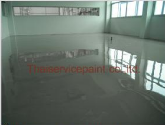
ชื่องาน :Epoxy Self Leveling พื้นที่ใช้งาน :พื้นที่ในโรงงาน ส่วนสำนักงาน Location :ระยอง