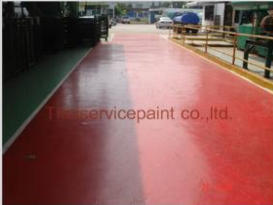
ชื่องาน :Epoxy Self Leveling พื้นที่ใช้งาน :ทางเดิน Location :ระยอง