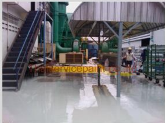
ชื่องาน :Epoxy Self Leveling พื้นที่ใช้งาน :พื้นที่ทางเดิน Location :นิคมฯสยามอีสเทิร์น