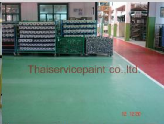
ชื่องาน :Epoxy Self Leveling พื้นที่ใช้งาน :พื้นที่ในโรงงาน วางสินค้า Location :ระยอง