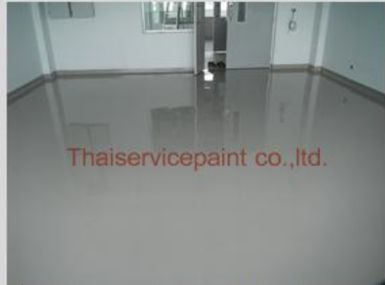
ชื่องาน :Epoxy Self Leveling พื้นที่ใช้งาน :สำนักงาน Location :ระยอง