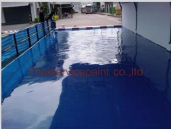
ชื่องาน :Epoxy Self Leveling พื้นที่ใช้งาน :พื้นที่ในโรงงาน Location :นิคมฯสยามอีสเทิร์น