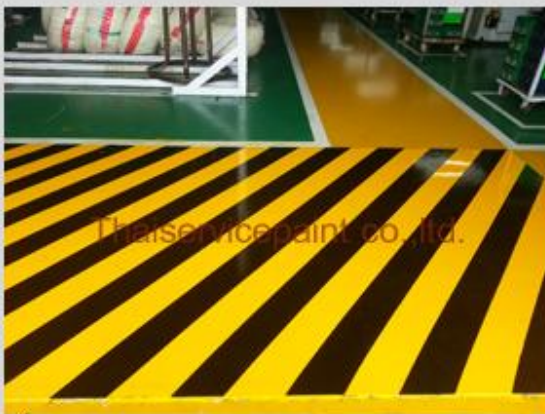
ชื่องาน :Epoxy Self Leveling พื้นที่ใช้งาน :พื้นที่ในโรงงาน และทางเดิน Location :นิคมฯสยามอีสเทิร์น