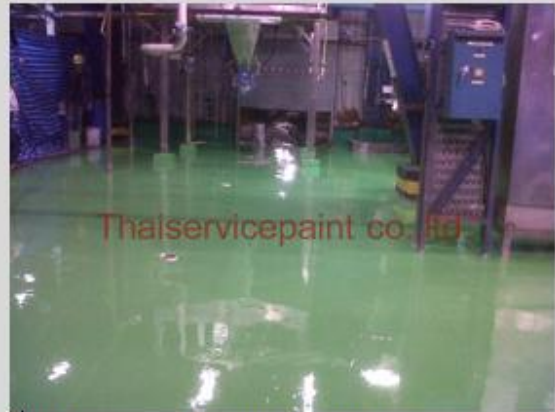
ชื่องาน :Epoxy Self Leveling พื้นที่ใช้งาน :พื้นที่ในโรงงาน วางเครื่องจักร Location :นิคมฯเหมราช ระยอง