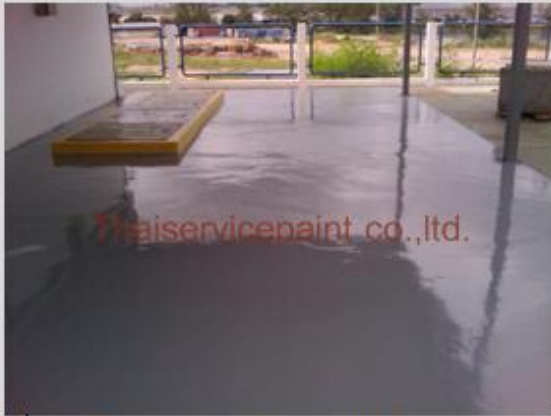
ชื่องาน :Epoxy Self Leveling พื้นที่ใช้งาน :พื้นที่ในโรงงาน วางเครื่องจักร Location :ระยอง