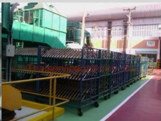
ชื่องาน :Epoxy Self Leveling พื้นที่ใช้งาน :พื้นที่ในโรงงาน วางสินค้า Location :ระยอง