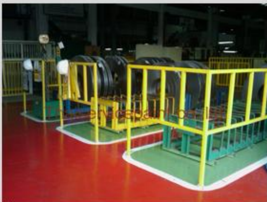
ชื่องาน :Epoxy Self Leveling พื้นที่ใช้งาน :พื้นที่ในโรงงาน วางสินค้า Location :นิคมฯสยามอีสเทิร์น