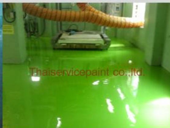
ชื่องาน :Epoxy Self Leveling พื้นที่ใช้งาน :พื้นที่ในโรงงาน วางเครื่องจักร Location :นิคมฯผาแดง