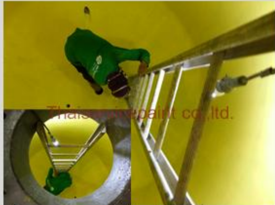
ชื่องาน :งานเคลือบสีอีพ็อกซี พื้นที่ใช้งาน :Tank เก็บสารเคมี Location :นิคมฯมาบตาพุด