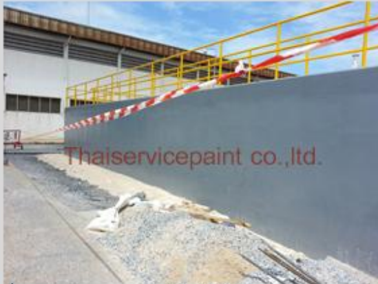
ชื่องาน :งานเคลือบสีอีพ็อกซี พื้นที่ใช้งาน :บ่อบำบัดน้ำเสีย Location :นิคมฯ ผาแดงอินดัสทรี