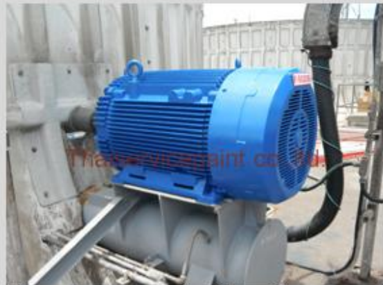
ชื่องาน :งานเคลือบสีอีพ็อกซี พื้นที่ใช้งาน :มอเตอร์ Location :นิคมฯ มาบตาพุด