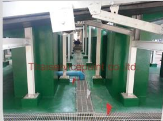
ชื่องาน :งานเคลือบสีอีพ็อกซี พื้นที่ใช้งาน :พื้นที่บริเวณฝ่ายผลิต Location :นิคมฯ มาบตาพุด