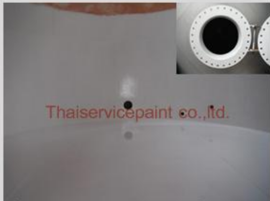
ชื่องาน :งานเคลือบสีอีพ็อกซี พื้นที่ใช้งาน :Tank เก็บสารเคมี Location :นิคมฯ ผาแดงอินดัสทรี