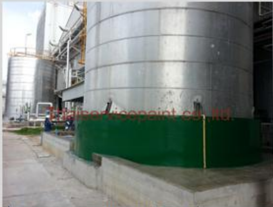
ชื่องาน :งานเคลือบสีอีพ็อกซี พื้นที่ใช้งาน :Pipe Cooling Tower Location :มศว.องครักษ์