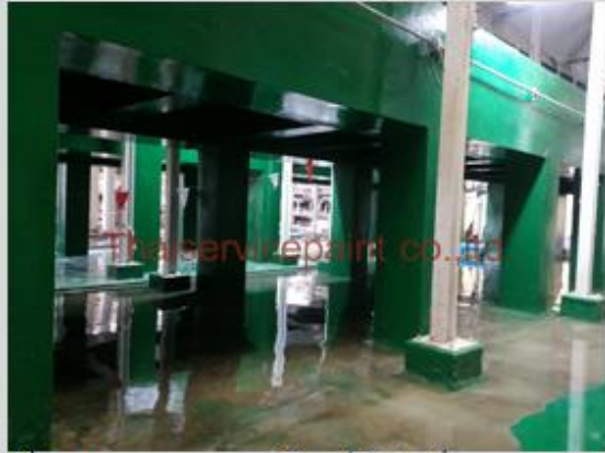
ชื่องาน :งานเคลือบสีอีพ็อกซี พื้นที่ใช้งาน :แท้งค์เก็บสารเคมี Location :นิคมฯ มาบตาพุด