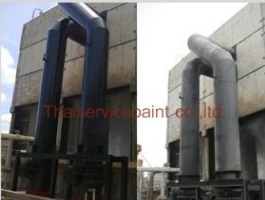
ชื่องาน :งานเคลือบสีอีพ็อกซี พื้นที่ใช้งาน :หอ Cooling Location :นิคมฯ มาบตาพุด