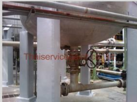
ชื่องาน :งานเคลือบสีอีพ็อกซี่ พื้นที่ใช้งาน :Tank เก็บสารเคมี Location :นิคมฯ มาบตาพุด