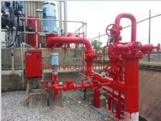
ชื่องาน :งานเคลือบสีอีพ็อกซี่ พื้นที่ใช้งาน :ท่อดับเพลิง Location :นิคมฯ มาบตาพุด