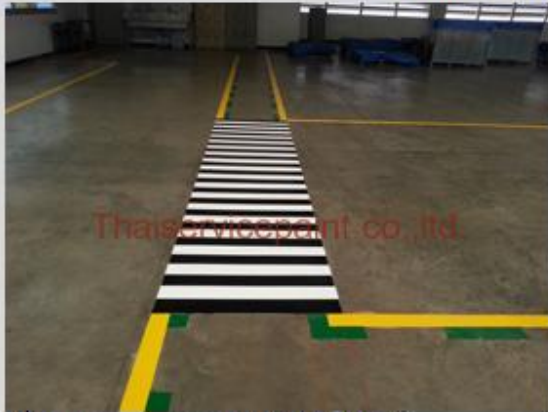
ชื่องาน :งานเคลือบสีอีพ็อกซี พื้นที่ใช้งาน :เส้นจราจรภายในโรงงาน Location :นิคมฯ อีสเทิร์นซีบอร์ด