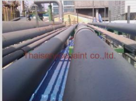
ชื่องาน :งานเคลือบสีอีพ็อกซี พื้นที่ใช้งาน :ท่อส่งสารเคมี Location :นิคมฯ มาบตาพุด