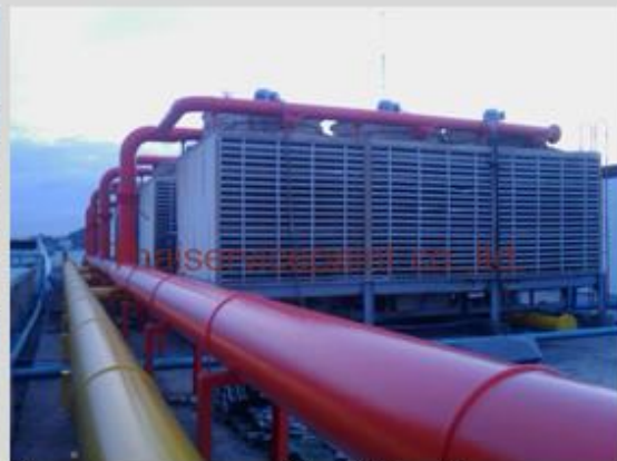
ชื่องาน :งานเคลือบสีอีพ็อกซี่ พื้นที่ใช้งาน :Cooling Tower Location :รพ.ศิริราช