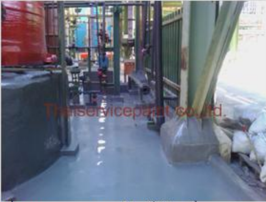
ชื่องาน :งานเคลือบสีอีพ็อกซี พื้นที่ใช้งาน :พื้นที่บริเวณเก็บสารเคมี Location :นิคมฯ เหมราช ระยอง