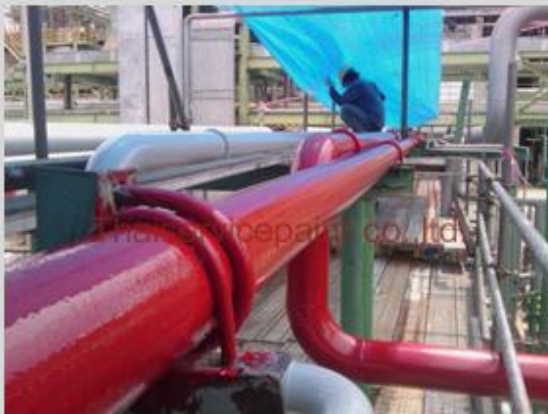
ชื่องาน :งานเคลือบสีอีพ็อกซี่ พื้นที่ใช้งาน :ท่อส่งเคมี Location :นิคมฯ สวแดงอินดัสทรี