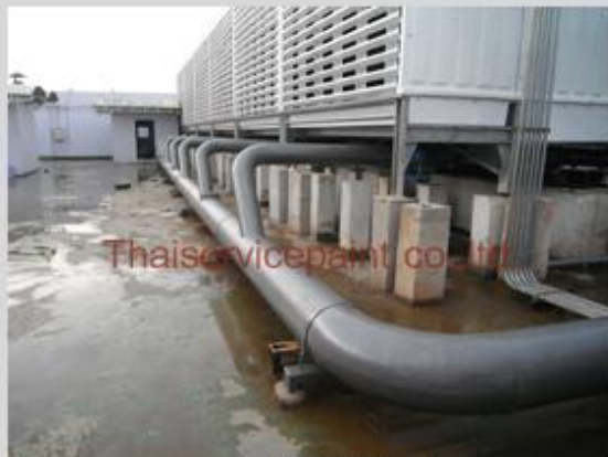
ชื่องาน :งานเคลือบสีอีพ็อกซี่ พื้นที่ใช้งาน :Pipe Cooling Tower Location :มศว.องครักษ์