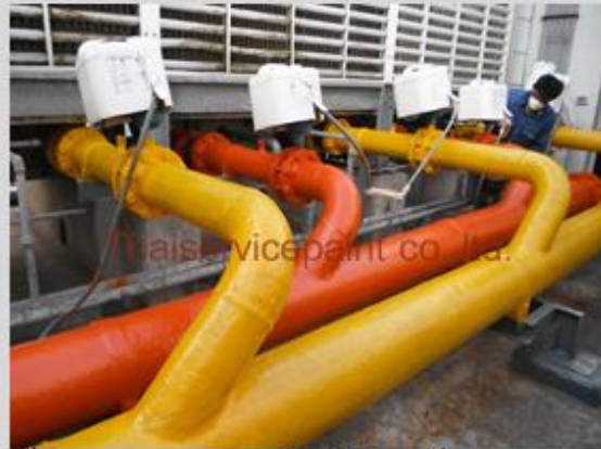
ชื่องาน :งานเคลือบสีอีพ็อกซี่ พื้นที่ใช้งาน :Pipe Cooling Tower Location :ม.เกษตร บางเขน