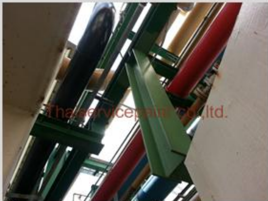
ชื่องาน :งานเคลือบสีอีพ็อกซี พื้นที่ใช้งาน :ท่อส่งเคมี Location :นิคมฯ มาบตาพุด