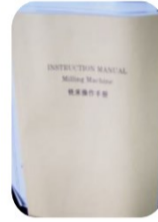
คู่มือการใช้งาน