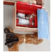
อุปกรณ์ในกล่องเครื่องมือ