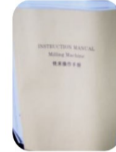
ตู้มือการใช้งาน