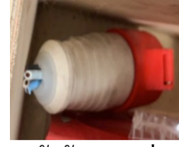
หัวจับดอกสว่าน