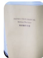
คู่มือการใช้งาน