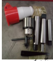
พาวเวอร์ปลั๊ก