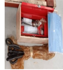
อุปกรณ์ในกล่องเครื่องมือ