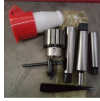
พาวเวอร์ปลั๊ก