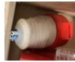
หัวจับดอกสว่าน