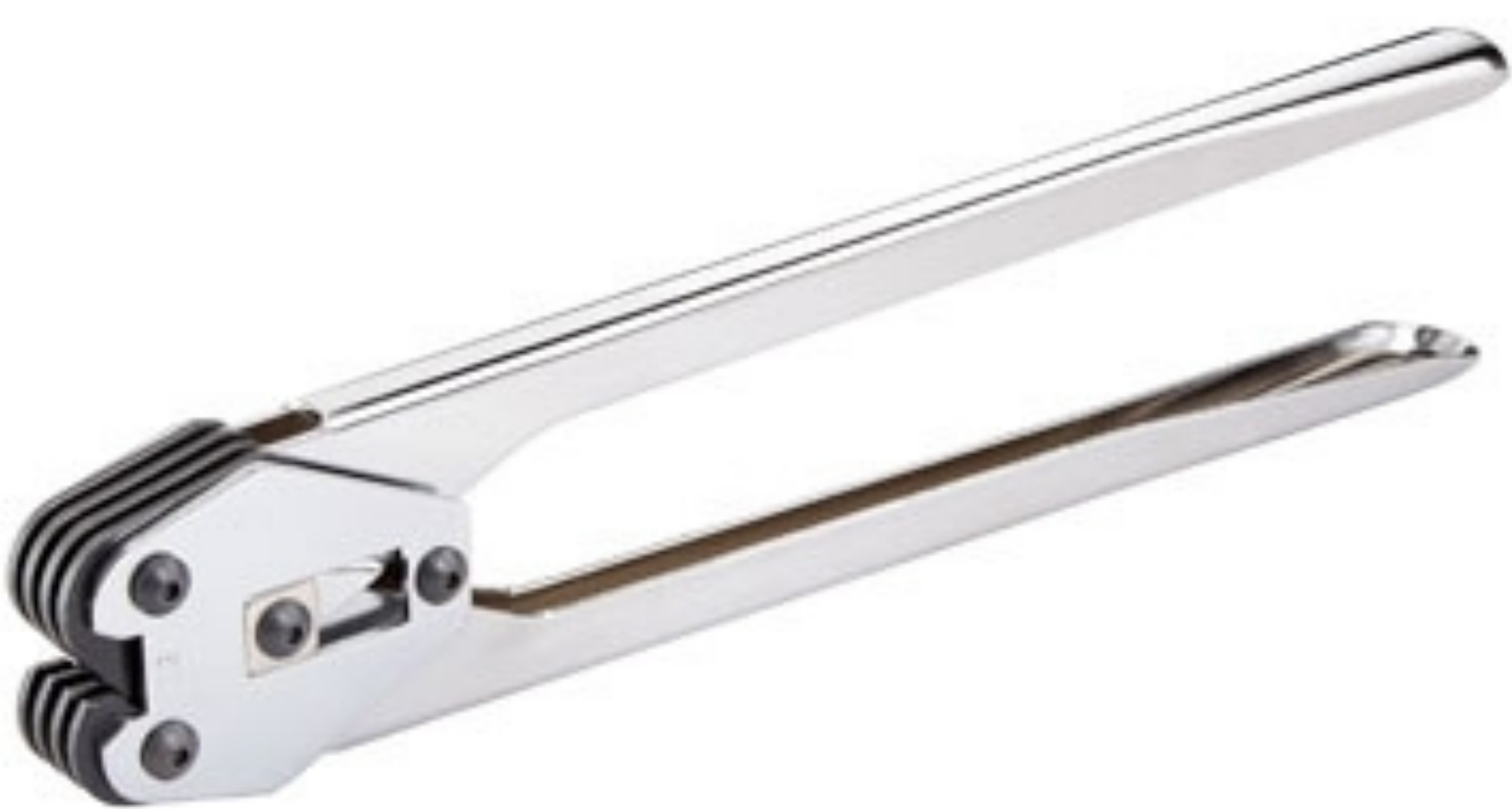
คีมรัดสายรัดพลาสติก ยี่ห้อ TRANSPAK รุ่น H-36