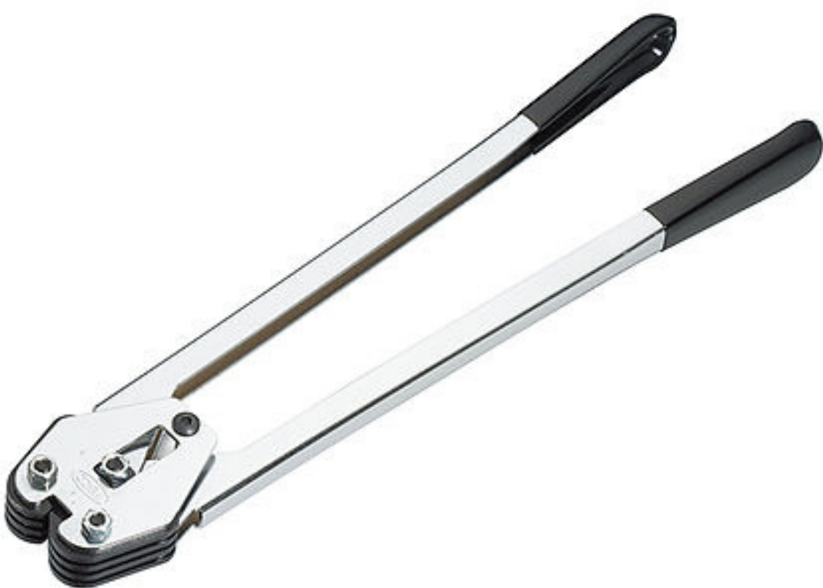
คีมรัดสายรัดพลาสติก ยี่ห้อ YBICO รุ่น C5006