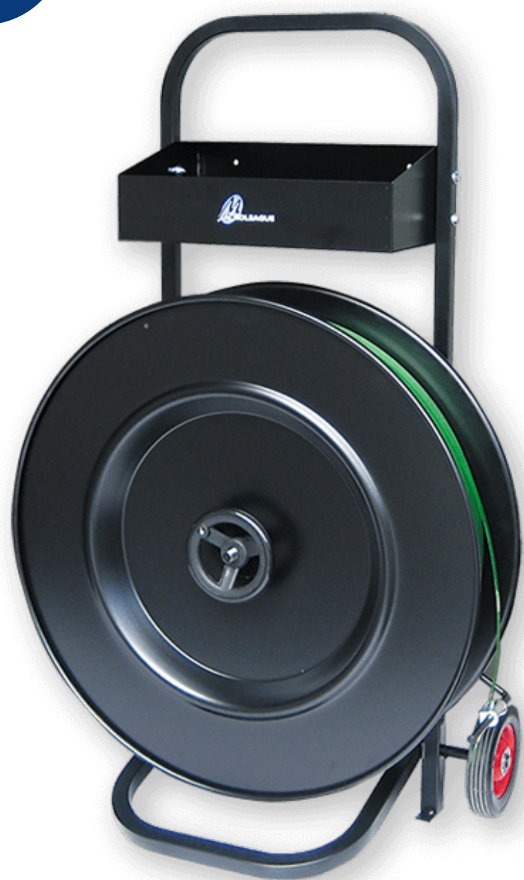
รถเข็นใส่สายรัดพลาสติก ยี่ห้อ Macroleague รุ่น DM400