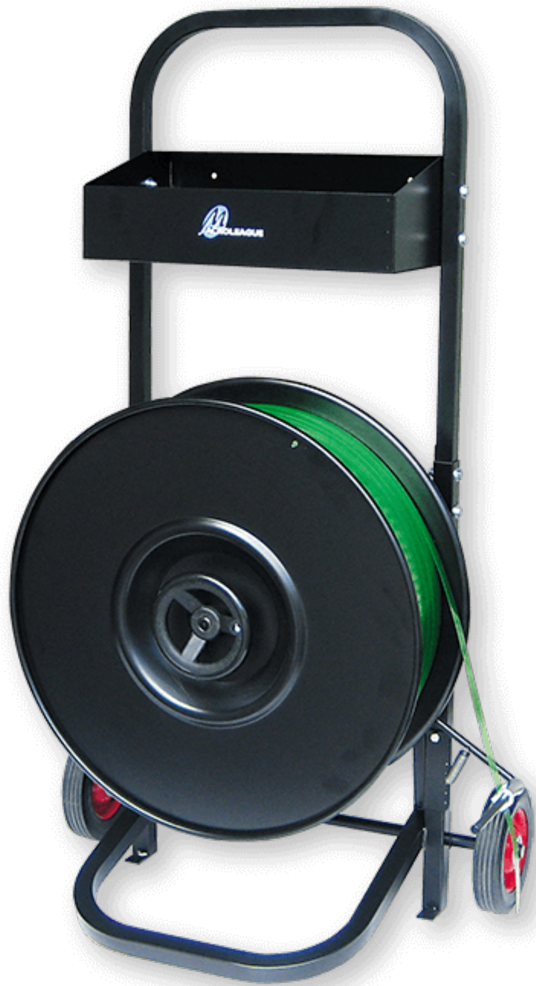
รถเข็นใส่สายรัดพลาสติก ยี่ห้อ Macroleague รุ่น DM200