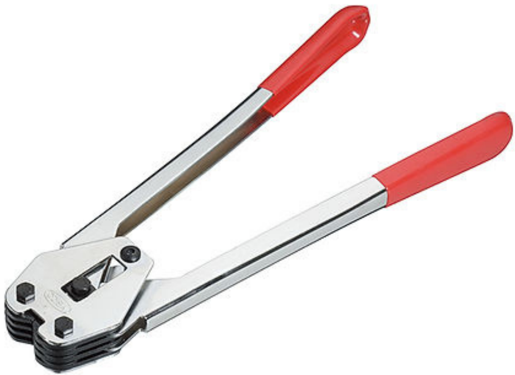
คีมรัดสายรัดพลาสติก ยี่ห้อ YBICO รุ่น C3016